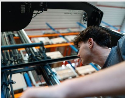
Pancerny szklany dach High Vision zapewniający optymalną widoczność