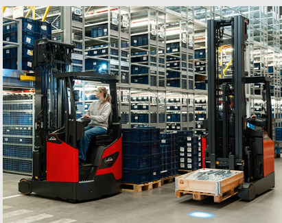
Bezwyśiolkowa i efektywna obsługa ładunku