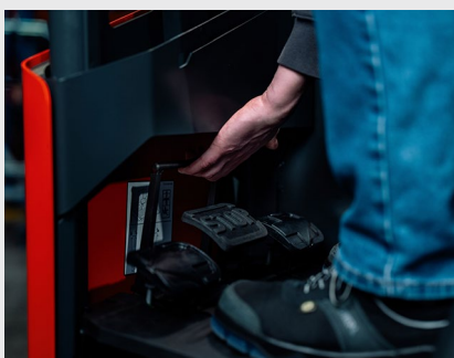
Regulowana wysokościowo płyta pedałów zapewniająca maksymalny komfort operatora