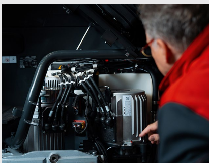
Szybki dostęp do wszystkich podzespołów serwisowych

Zastrzegamy sobie prawo do zmian w celu ulepszenia produktu. Ilustracje i specyfikacje techniczne mogą zawierać opcje i nie są wiążące dla rzeczywistych konstrukcji. Wszystkie wymiary podlegają standardowym tolerancjom.